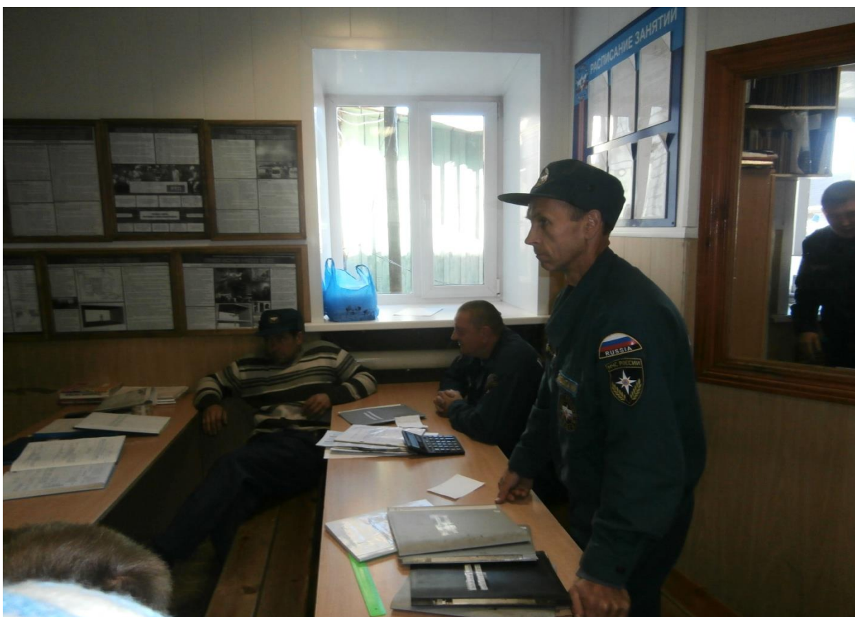
В этой комнате расчеты караула занимаются.