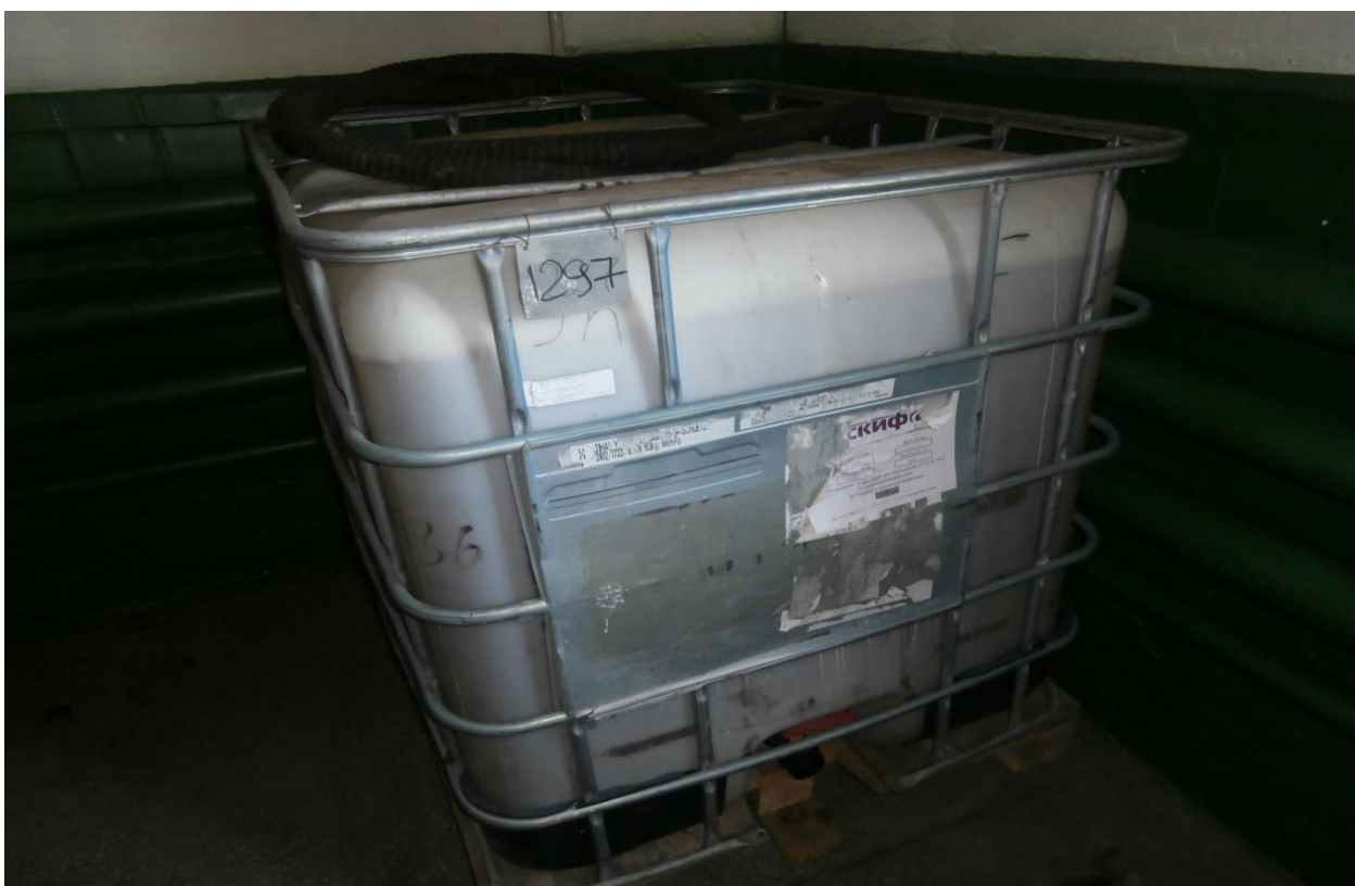
В этой ёмкости хранится пена для тушения пожаров.