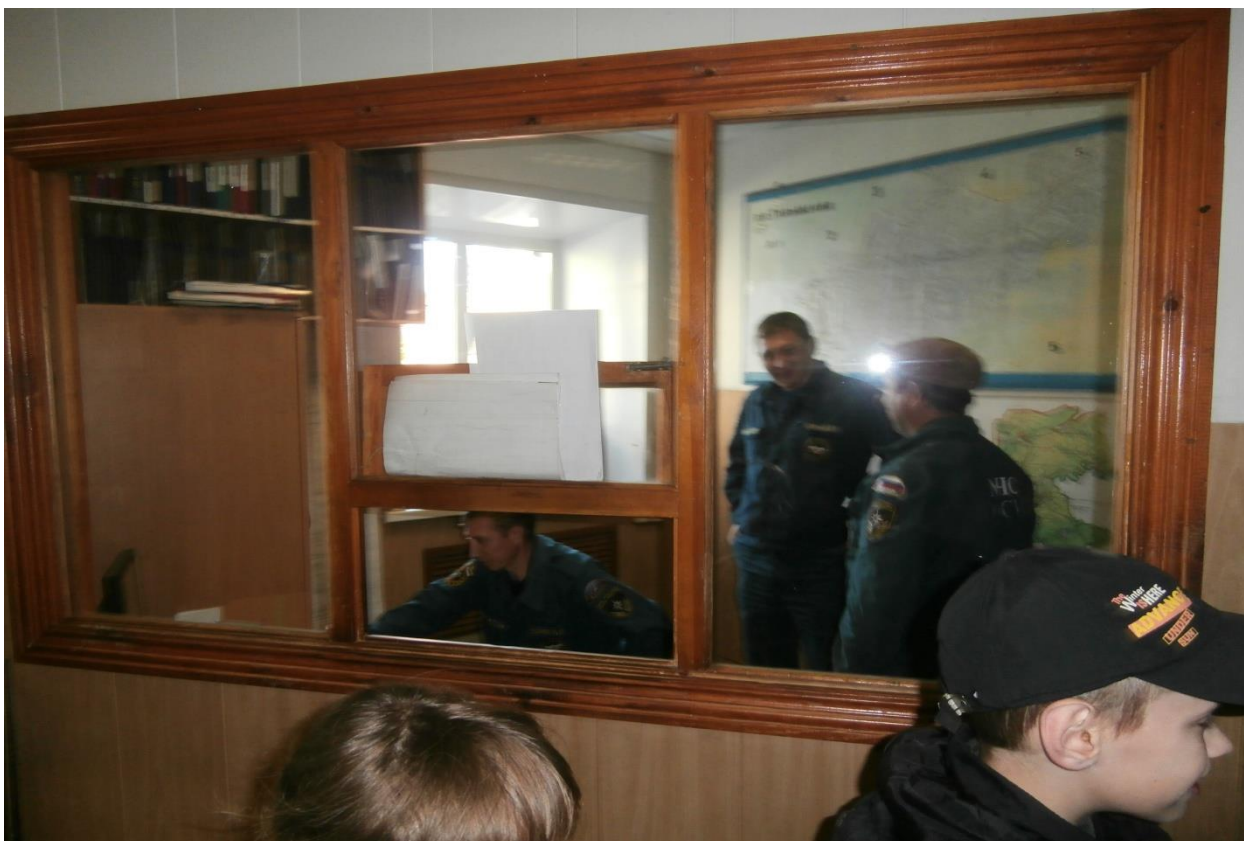
Комната приёма сообщений о пожаре.