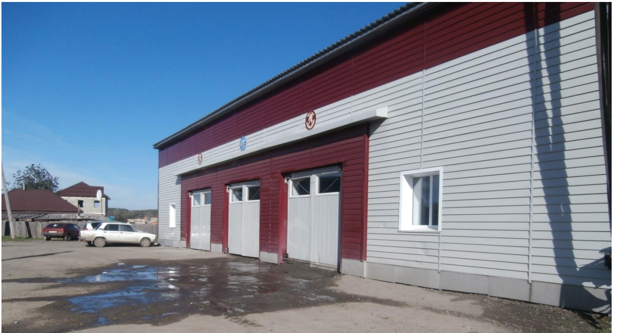
Здание пожарной части.