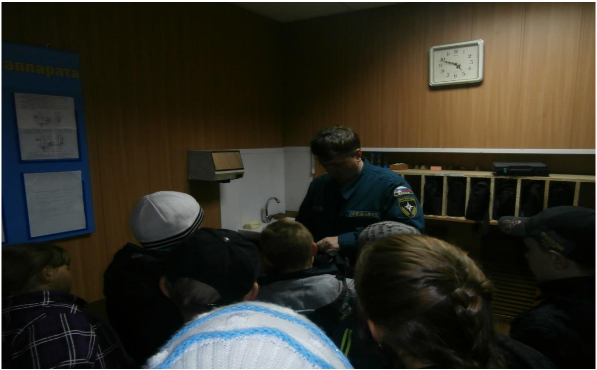
Использование кислородной маски.